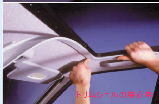
トリムシェルの装着時